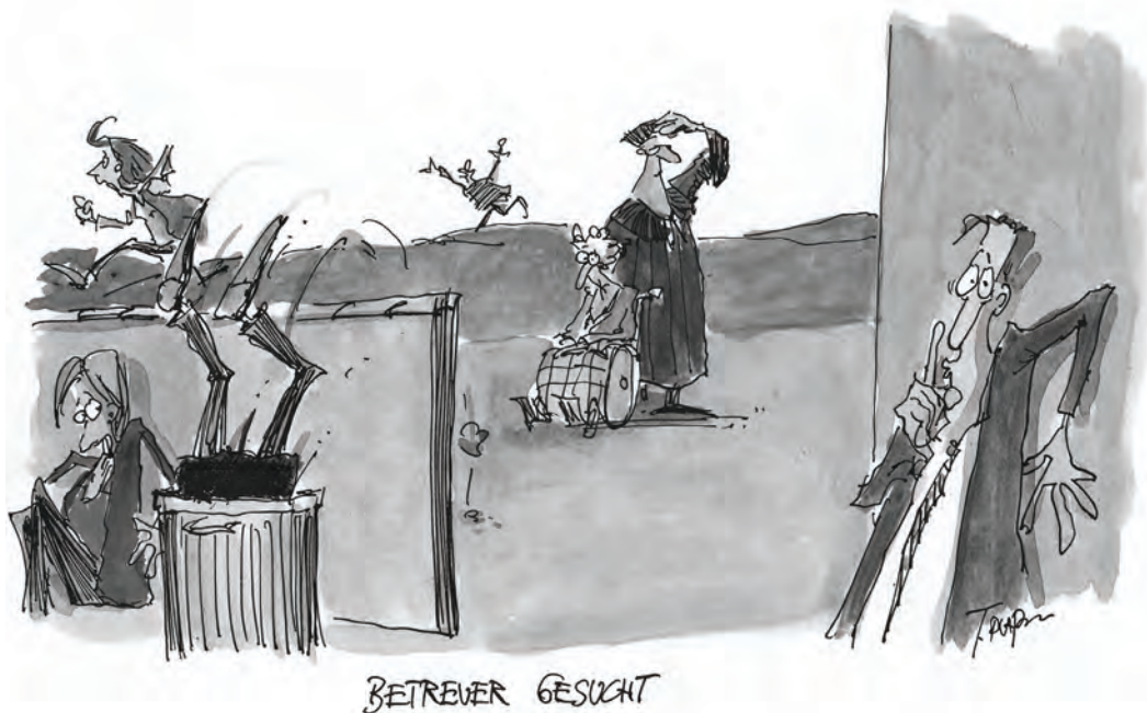
Cartoon: Thomas Plaßmann